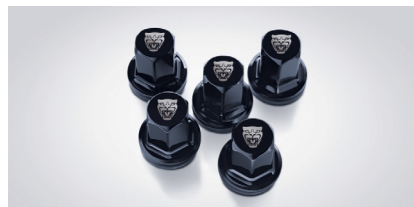
Écrous de roue Growler Soulignez l'aspect des roues de votre véhicule avec les écrous de roue noirs griffés Jaguar.