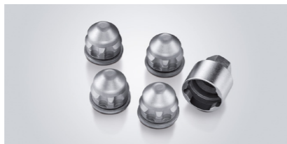
Écrous de roue antivol chromés Protégez vos roues avec ces écrous antivol chromés spécialement conçus pour votre véhicule.