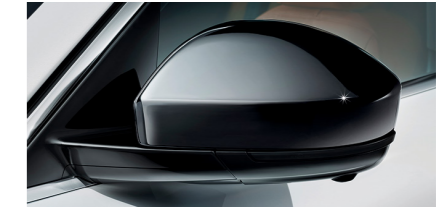
Coques de rétroviseur noir lustré Les coques de rétroviseurs noir lustré soulignent le design dynamique des rétroviseurs extérieurs.