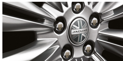
Cache-moyeu Insigne distinctif de centre monochrome portant le logo Jaguar et le dessin de l'Union Jack, pour donner une touche britannique.