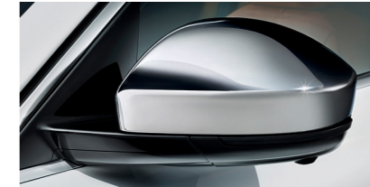
Coques de rétroviseur chromées Ces coques chromées soulignent le design élégant des rétroviseurs extérieurs.