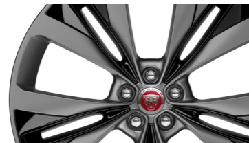
Jantes en alliage de 22 po Double Helix à 15 rayons au fini argenté avec insertions noires.