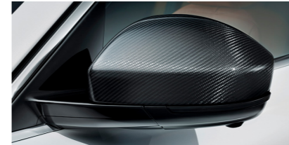
Coques de rétroviseur en fibre de carbone Ces coques de rétroviseurs en fibre de carbone de haute qualité accentuent avec style l'aspect performant du véhicule.