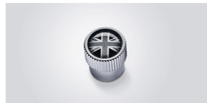
Capuchons de valve ornés Ajoutez la touche finale aux jantes de votre véhicule avec des capuchons de valve faits sur mesure.