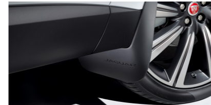
Garde-boues avant et arrière Les garde-boues griffés Jaguar complètent les lignes de votre véhicule, réduisent les projections et assurent une protection contre la poussière et les gravillons.