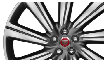
Jantes en alliage de 22 po Turbine à 9 rayons au fini gris usiné au diamant.