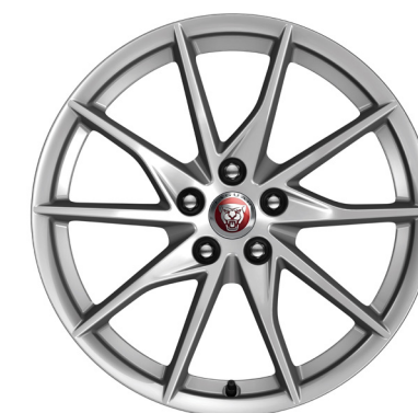
Jantes de 18 po à 10 rayons (Style 1036)