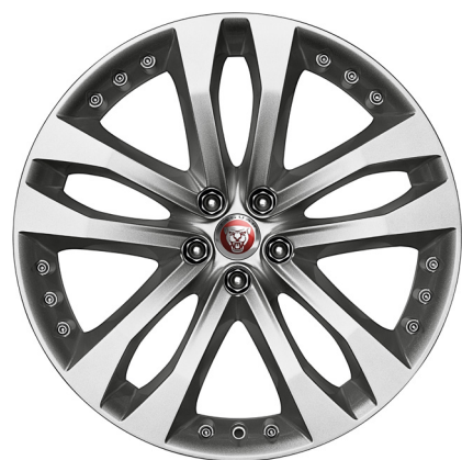
Jantes de 20 po à 5 rayons divisés (Style 5039)