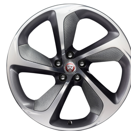
Jantes forgées de 20 po à 5 rayons (Style 5062) au fini fibre de carbone avec tressage argent