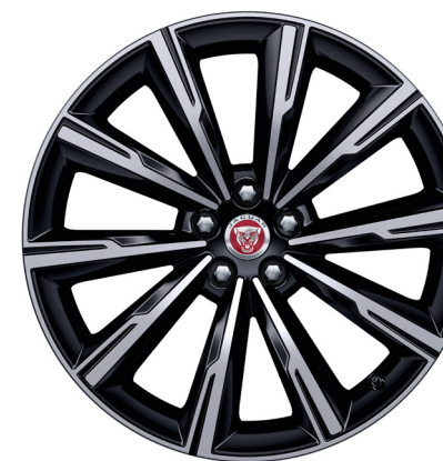
Jantes de 20 po à 10 rayons (Style 1066) au fini noir lustré usiné au diamant