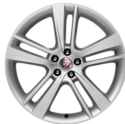
Jantes de 20 po à 5 rayons divisés (Style 5041)