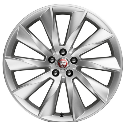
Jantes de 20 po à 10 rayons (Style 1025)