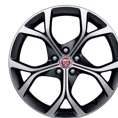
Jantes de 19 po à 5 rayons divisés (Style 5101) au fini noir lustré usiné au diamant