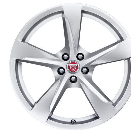
Jantes de 20 po à 5 rayons (Style 5060)