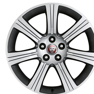
Jantes de 18 po à 7 rayons (Style 7017)