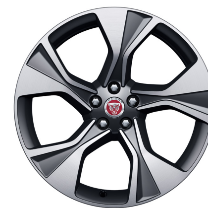
Jantes de 20 po à 5 rayons (Style 5102) au fini gris satiné usiné au diamant