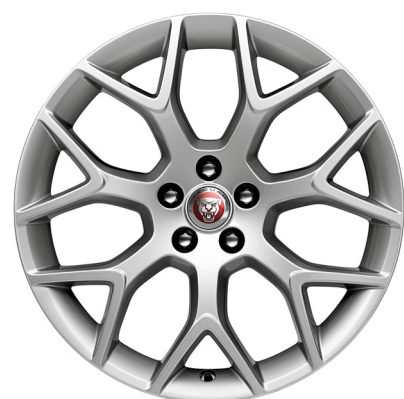
Jantes de 19 po à 7 rayons divisés (Style 7013)