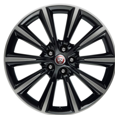
Jantes de 19 po à 10 rayons (Style 1026) au fini noir lustré usiné au diamant