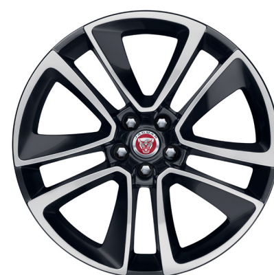
Jantes de 19 po à 5 rayons divisés (Style 5058) au fini gris satiné usiné au diamant