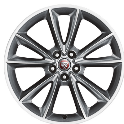
Jantes de 19 po à 5 rayons divisés (Style 5057)