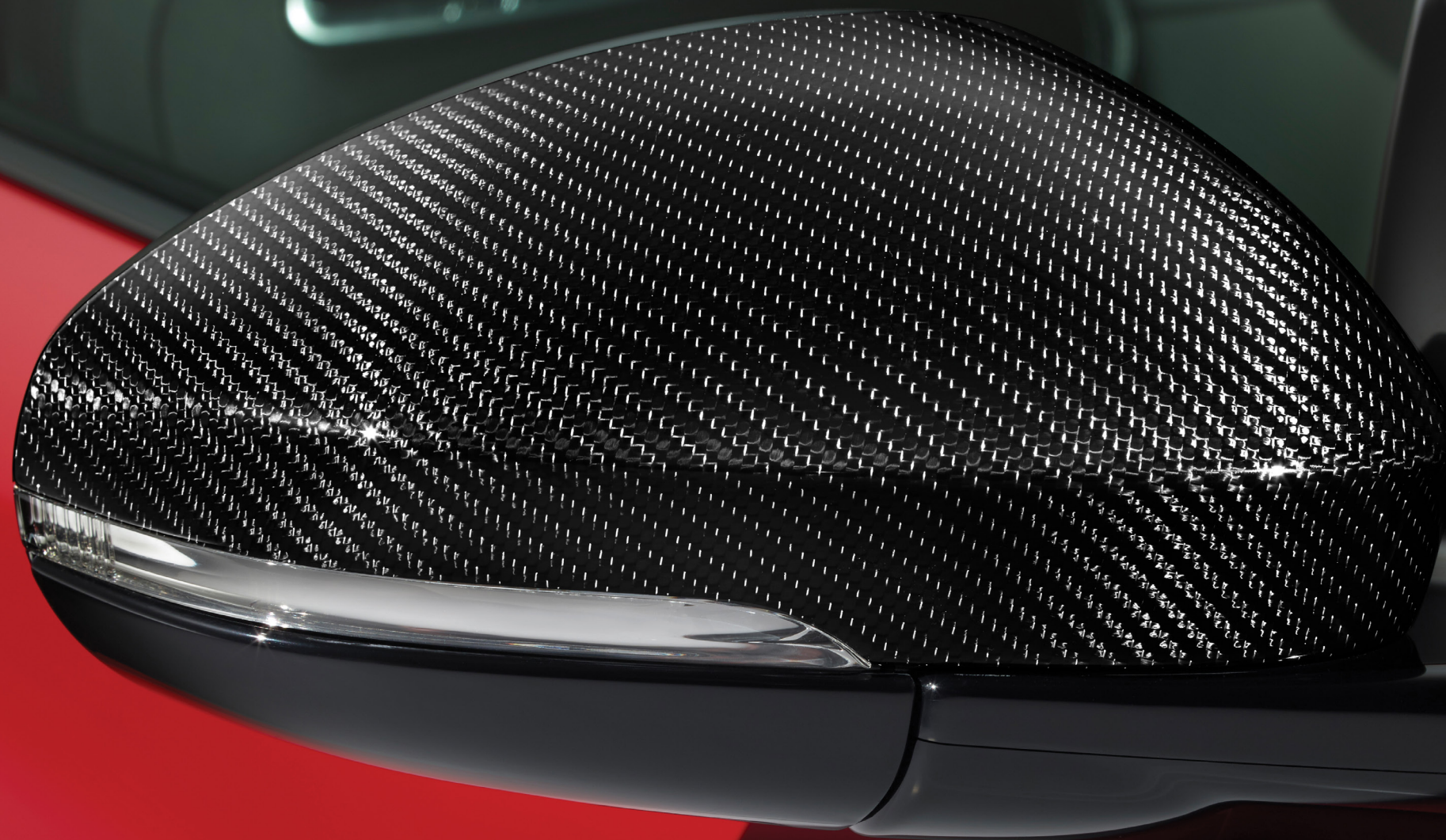
Coques de rétroviseur en fibre de carbone avec tressage argent

Les coques de rétroviseur et les arceaux de sécurité en fibre de carbone avec tressage argent de qualité supérieure offrent un style amélioré inspiré de la performance. Elles arborent une armure sergé 2x2 en aluminium attrayante et un fini verni ultra lustré.