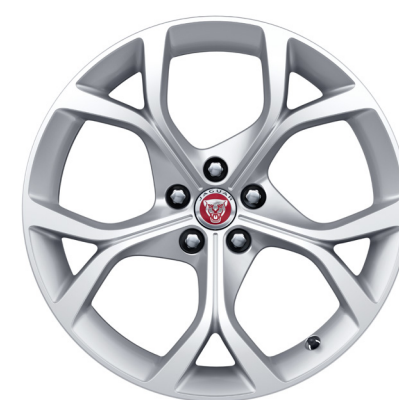
Jantes de 19 po à 5 rayons divisés (Style 5101) au fini argent