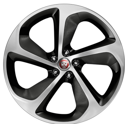
Jantes forgées de 20 po à 5 rayons (Style 5062)