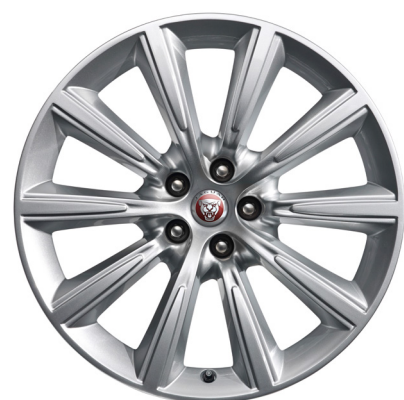
Jantes de 19 po à 10 rayons (Style 1026)