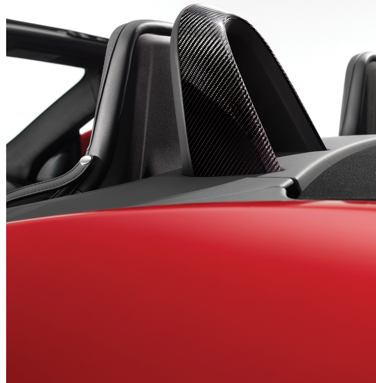
Arceaux de sécurité en fibre de carbone avec tressage argent