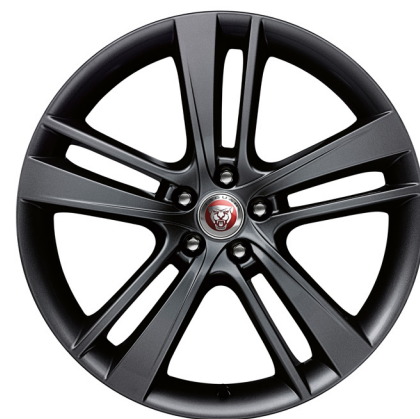
Jantes de 20 po à 5 rayons divisés (Style 5041) au fini noir lustré