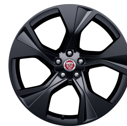
Jantes de 20 po à 5 rayons (Style 5102) au fini noir lustré