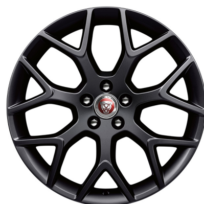
Jantes de 19 po à 7 rayons divisés (Style 7013) au fini noir