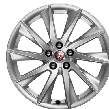
Jantes de 18 po à 10 rayons (Style 1024)