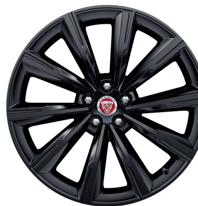
Jantes de 20 po à 10 rayons (Style 1066) au fini noir lustré