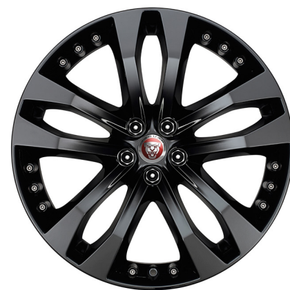
Jantes de 20 po à 5 rayons divisés (Style 5039) au fini noir lustré