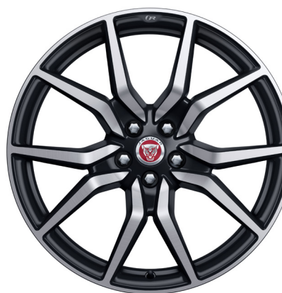
Jantes forgées de 20 po à 10 rayons (Style 1041) au fini noir satiné usiné au diamant