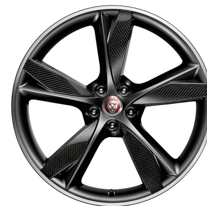
Jantes forgées de 20 po à 5 rayons divisés (Style 5042) au fini gris foncé satiné usiné au diamant en fibre de carbone