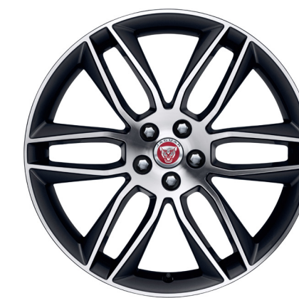
Jantes de 20 po à 6 rayons divisés (Style 6003) au fini gris foncé usiné au diamant