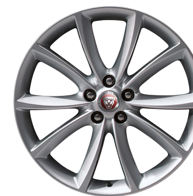
Jantes de 19 po à 10 rayons (Style 1023)