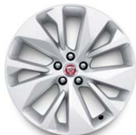
Jantes de 19 po à 5 rayons divisés (Style 5106) au fini argent