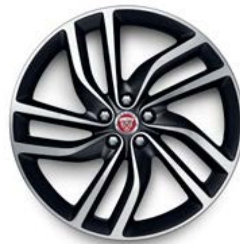
Jantes de 20 po à 5 rayons divisés (Style 5036) au fini gris foncé satiné usiné au diamant