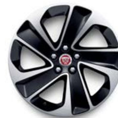
Jantes de 18 po à 5 rayons (Style 5105) au fini gris foncé usiné au diamant