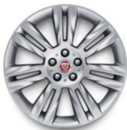
Jantes de 18 po à 7 rayons divisés (Style 7011) au fini argent