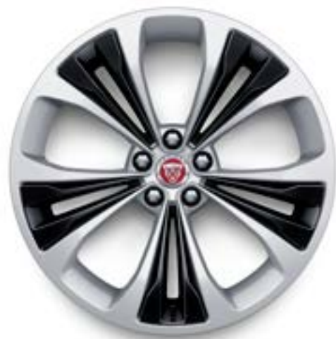
Jantes de 20 po à 5 rayons divisés (Style 5107) avec insertions argent au fini noir lustré