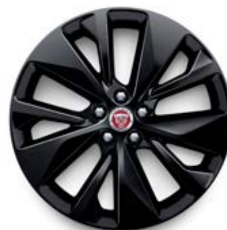
Jantes de 19 po à 5 rayons divisés (Style 5106) au fini noir lustré