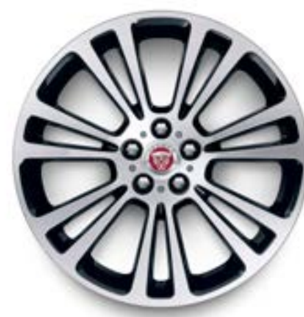
Jantes de 19 po à 7 rayons divisés (Style 7013) au fini usiné au diamant contrastant