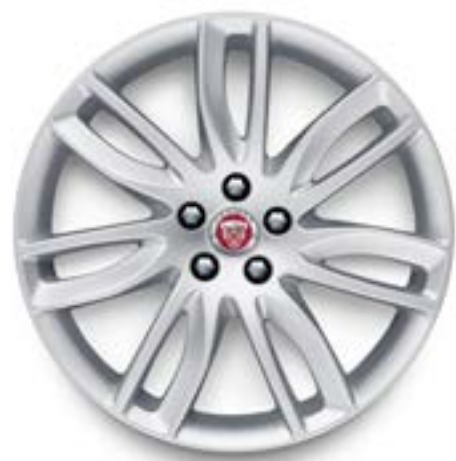
Jantes de 19 po à 7 rayons divisés (Style 7012) au fini argent

Personnalisez votre véhicule avec un choix de jantes en alliage qui affichent une vaste gamme de designs contemporains et dynamiques.