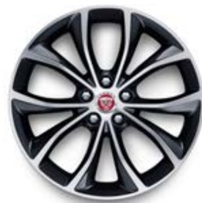
Jantes de 18 po à 5 rayons divisés (Style 5033) au fini usiné au diamant contrastant