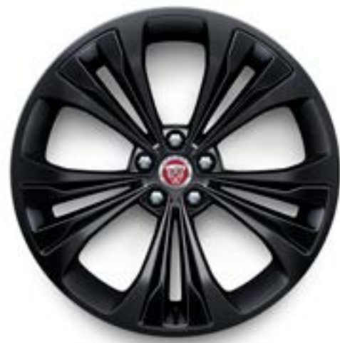
Jantes de 20 po à 5 rayons divisés (Style 5107) avec insertions noir satiné au fini noir lustré