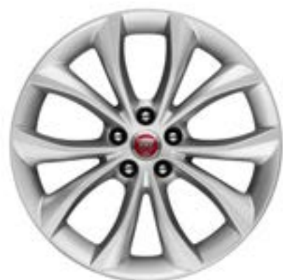
Jantes de 18 po à 5 rayons divisés (Style 5033) au fini argent

Personnalisez votre véhicule avec un choix de jantes en alliage qui affichent une vaste gamme de designs contemporains et dynamiques.