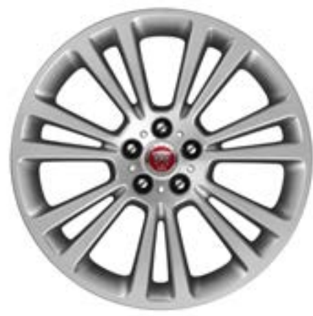
Jantes de 19 po à 7 rayons divisés (Style 7013) au fini argent