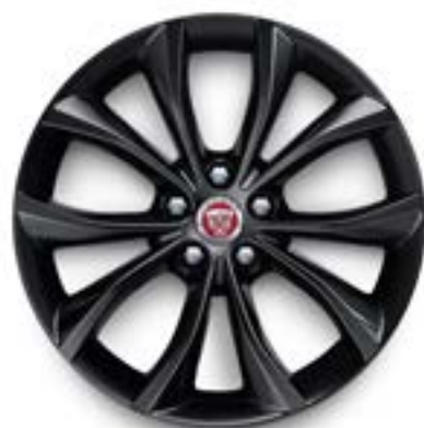
Jantes de 18 po à 5 rayons divisés (Style 5033) au fini noir lustré